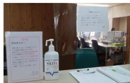
ビニールカーテンと消毒剤の設置